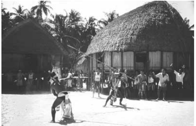
Käppfäktning, traditionellt inslag i den årliga benhusfesten Kinruaka på Nikobarerna.

Nikobarerna representerar något så underligt som en ännu ganska orörd ögrupp. Turister släpps inte in, och befolkningen har kommit att bevara mycket av sin ursprungliga livsstil. Dagens nikobariska befolkning lever till största delen av havet och av öarnas inhemska produkter. Den viktigaste exportvaran är kopra. Vad framtiden kommer att föra med sig till Nikobarerna är det ingen som vet. Helt klart är att krävs mycket för att totalt förändra ögruppens ekonomi, men den indiska jordbrukarkolonin på Great Nicobar visar tydligt att dramatiska förändringar dock kan ske. Den lokala ekonomin, liksom livsstilen, är sårbar, och tillgång till modern medicin och förbättrade kommunikationer gör att öarna inte är lika isolerade som förr. Malaria som i alla tider skyddat öarna mot invasioner och koloniserare ger i dag inte längre samma skydd.