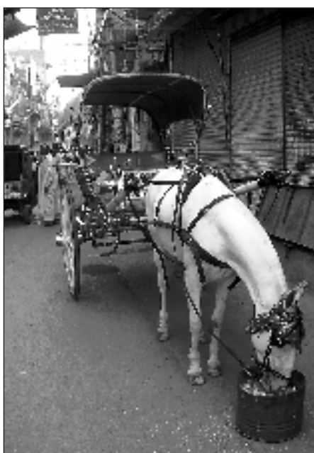
Hästdroska i Lahores gamla stadskärna.

Pakistan är naturligtvis en del av 'Indien', inte som land eller stat men som kultur och som historia. Människorna här i