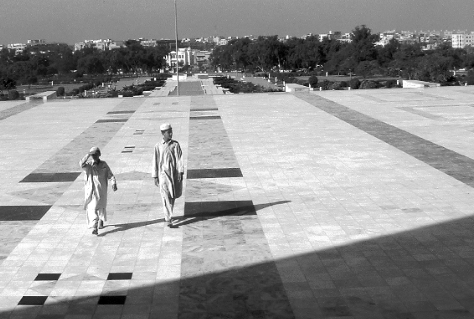
På väg till landsfadern Mohammed Ali Jinnahs mäktiga mausoleum i landets gamla huvudstad Karachi.

Jinnah som bara låste sitt hus i Bombay och for på som han trodde ett tidsbegränsat besök i Karachi – utan bara att deras grupper skulle få plats i det nya och självständiga Indien.