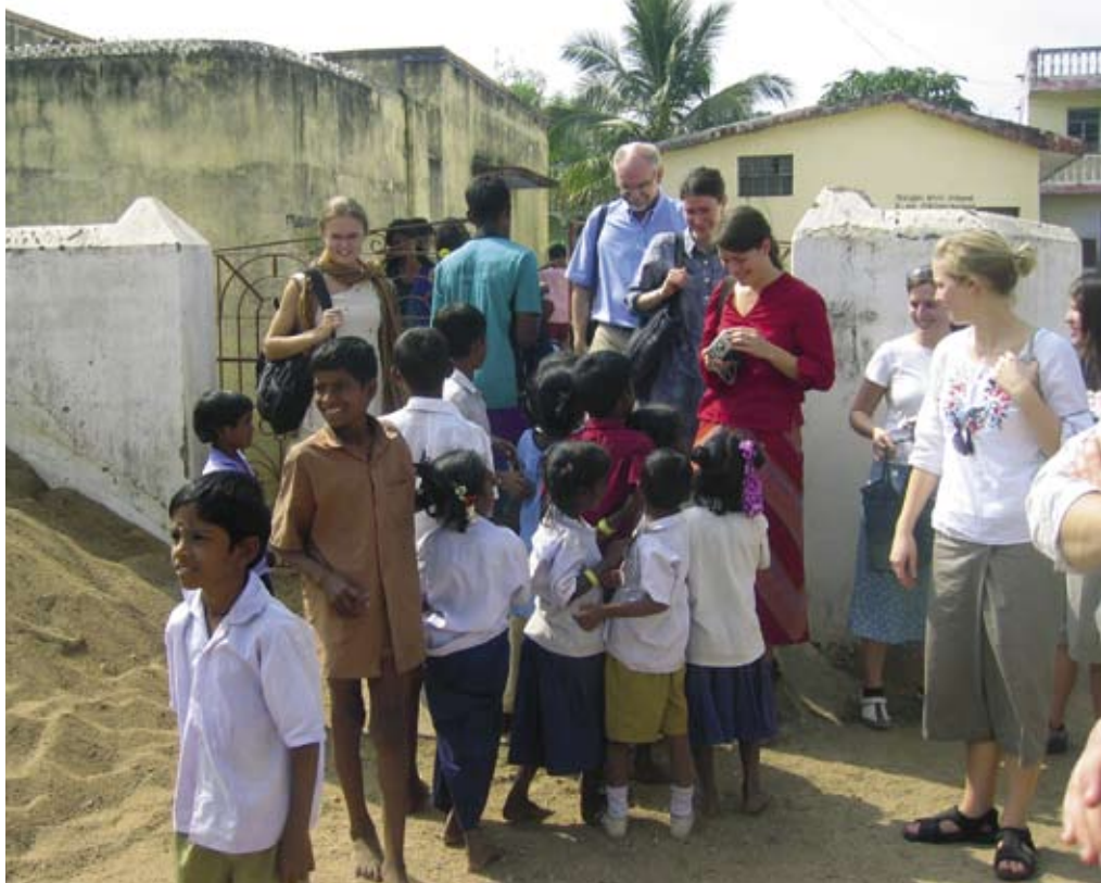
De svenska studenterna möts av en grupp intresserade skolbarn.

Att under två veckor få bo och leva tillsammans med sina studenter i sjukhusmiljöer i Indien och Uganda är också en särskild upplevelse för en lärare.