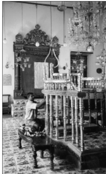
Synagogan i Kochi, Kerala, är Indiens äldsta. Den byggdes 1568.

På 700-talet f Kr anfölls kungariket Israel av assyrierna. Befolkningen deporterades, försvann ur historien och är sedan dess kända som de tio förlorade stammarna. Ungefär 130 år senare besegrades kungadömet Judah av babylonierna och även dess befolkning deporterades. Babylonierna besegrades i sin tur av perser-