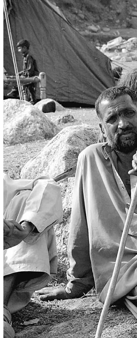
Överlevande efter jordbävningen sitter i spillror

– Vi har designen klar, nu gäller det att