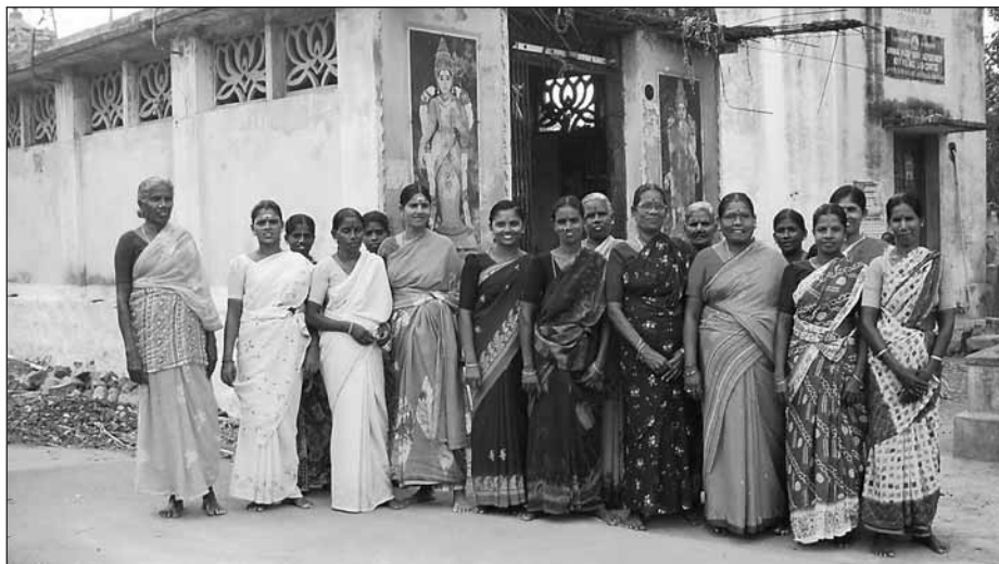
Medlemmarna i spargruppen Tamarai (Lotus) utanför Mariammatemplet i Poyyamani där de brukar ha möten.

Det var en offentligt planerad och organiserad utvecklingspolitik. I många områ-