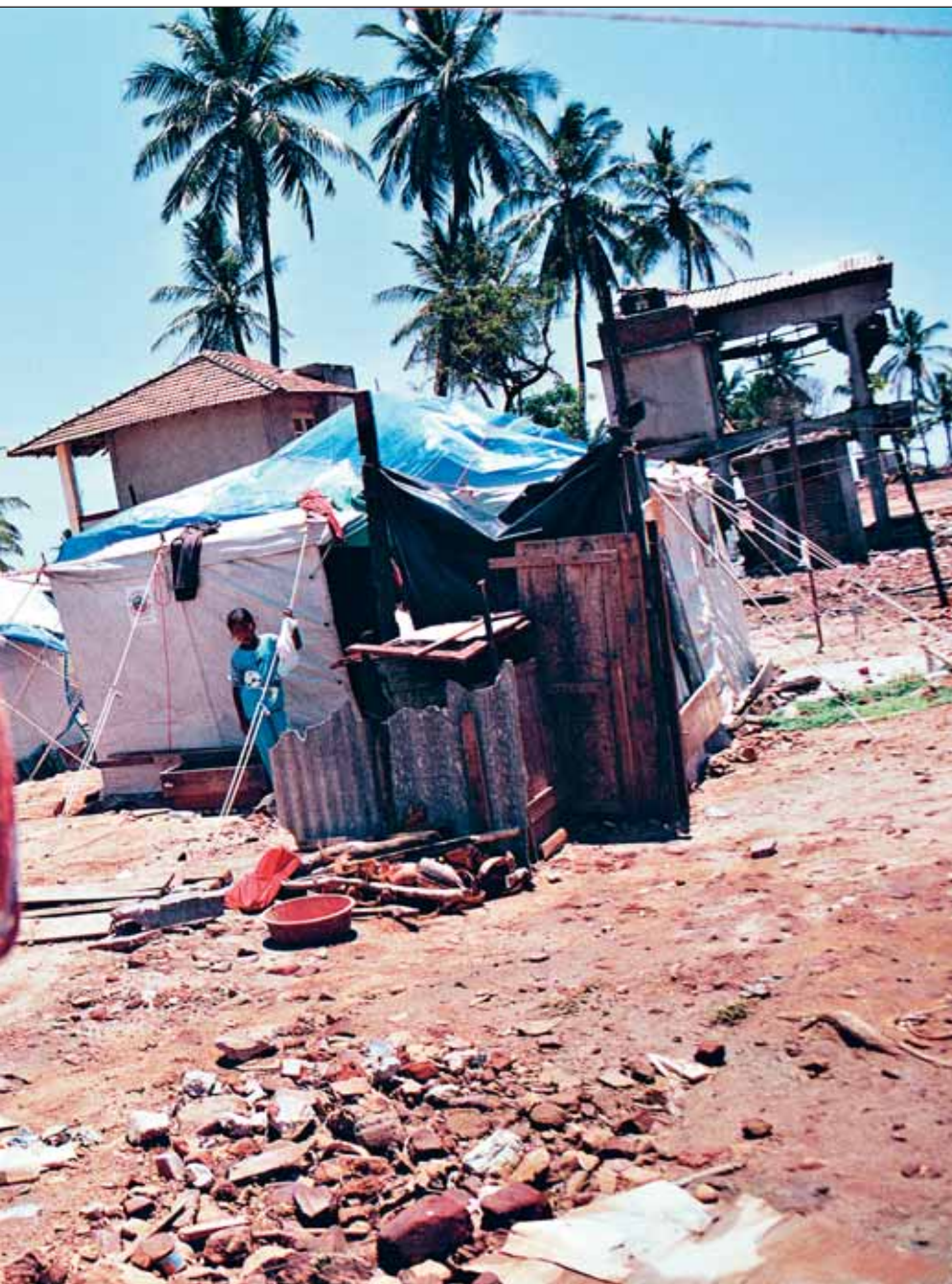
byggnader måste byggas upp igen. I väntan på det bor människor i provisoriska hem.

dess vackra stränder och lyxiga turisthotell är borta. De få byggnader som är kvar är märkta av tsunamin.