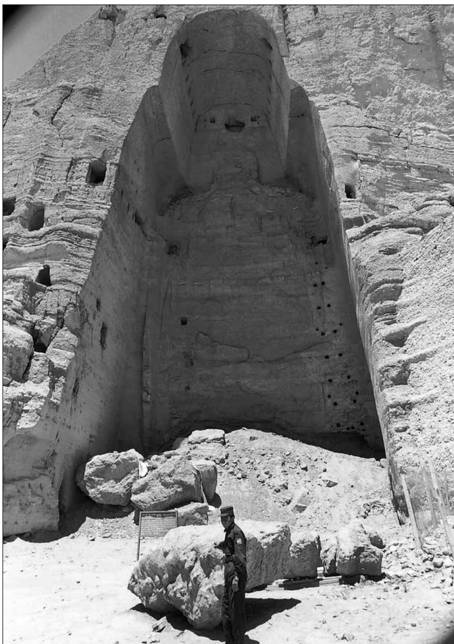
Soldaten Ali vaktar vid den största delen som finns kvar av den bortsprängda Buddhan. Fragmentet väger två ton.

Det råder delade meningar bland experterna. Några ivrar för att statyerna ska resas upp på nytt, att de ska byggas upp från topp till till så som de var innan de attackerades