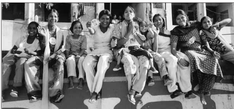
Skolbarn vinkar entusiastiskt till deltagarna i marschen.

Den gången höll Gandhi tal i byarna på vägen: han talade om moral och sedlighet, om civil olydnad, och förändrade Indien för gott. Nu utspelas ett annat slags drama i massmedierna. På natten ser jag ett inslag från nyhetskanalen NDTV där en gammal