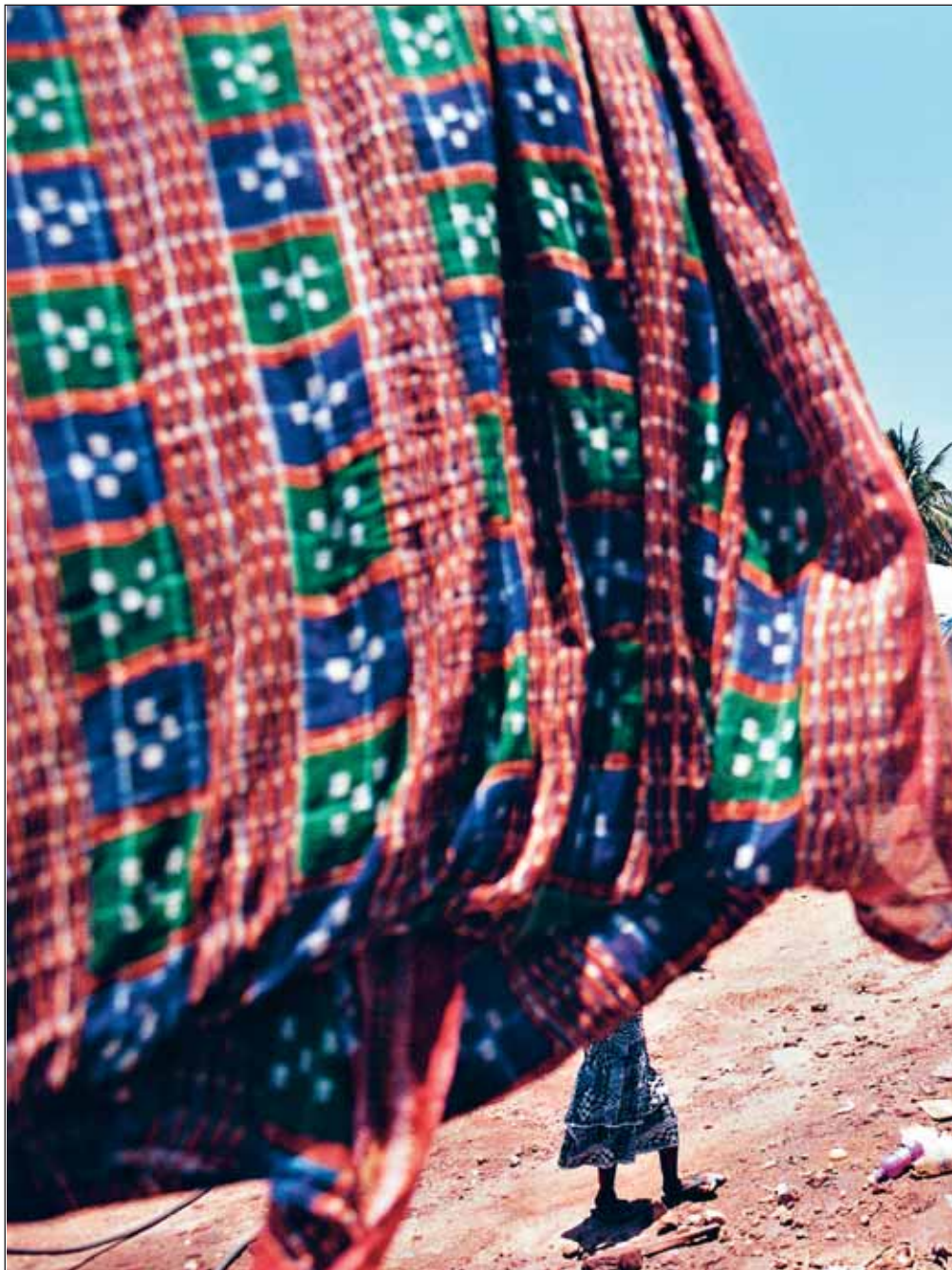
I Hambantota är det endast kyrkan och biblioteket som klarat sig hyfsat. Alla andra

I december 1994 gick jag och mina kusiner på Hambantotas strand och tittade på solnedgången. Det var på den tiden vi var