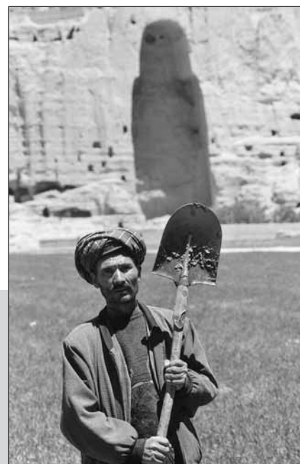
Bönder i området hyrs in för att hjälpa arkeologerna i jakten på jätdebuddhan.