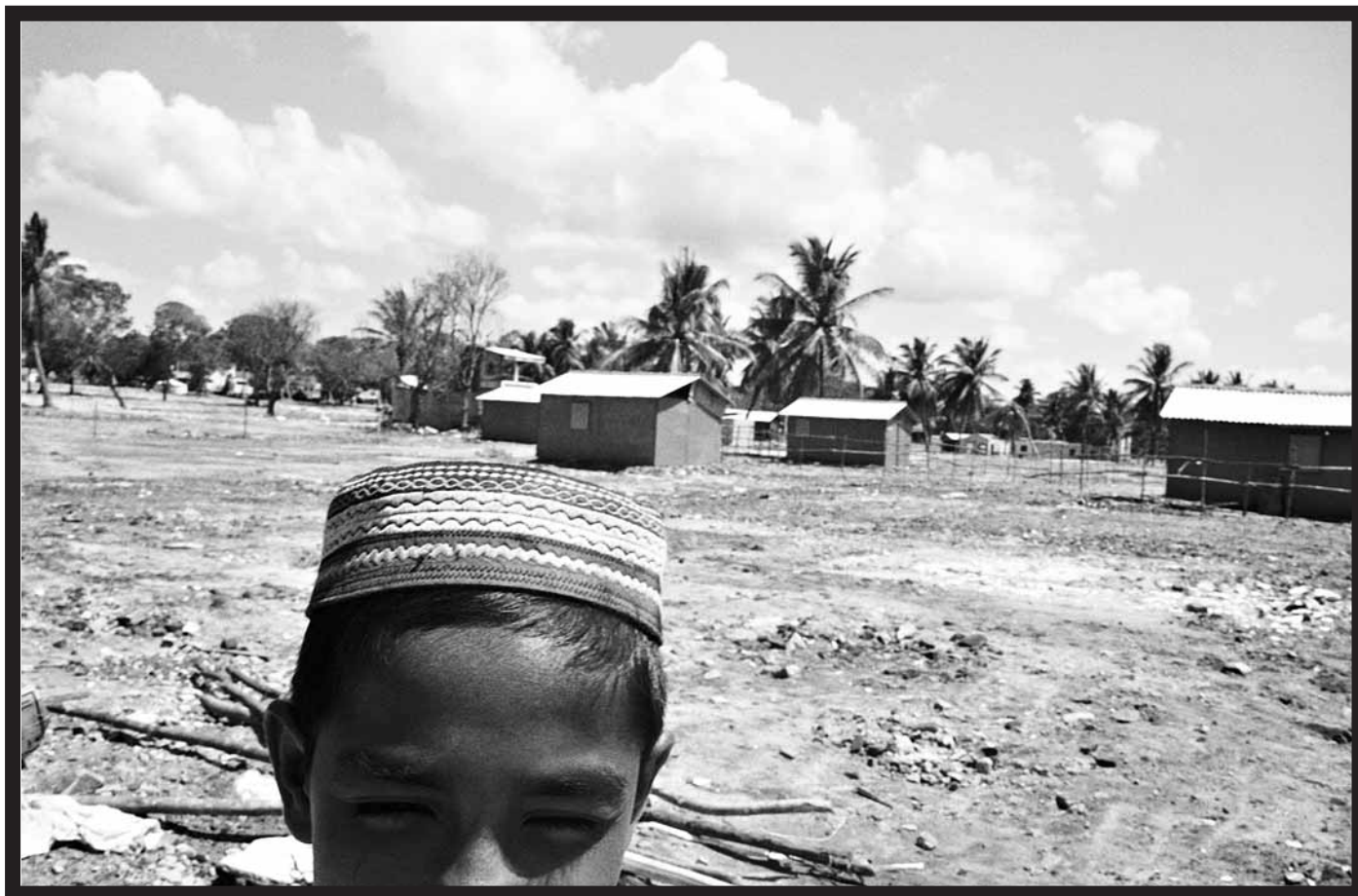
En muslimsk pojke står framför provisoriska hus som Röda halvmånen bygger upp i Hambantota, den lilla turiststaden på sydöstkusten som drabbades hårt av tsunamin.