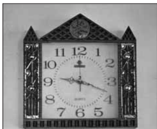
...klockan som stannat på 9.18. Då slog den första vågen in.