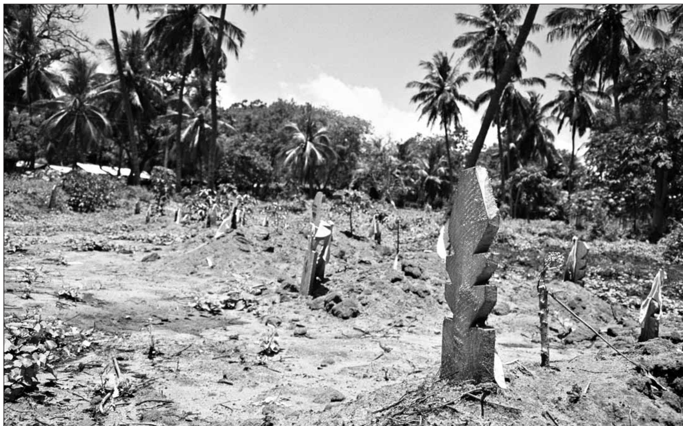
Massgravnen ligger på muslimskt område. På en yta, stor som en fotbollsplan, ligger över 3 000 kroppar. Endast ett fåtal döda har fått gravstenar, de flesta flodvågsoffer hann aldrig identifieras innan begravningen ägde rum.