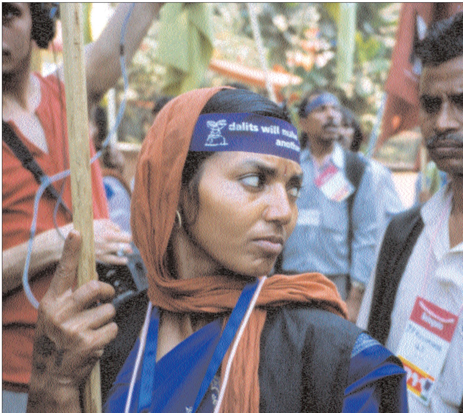
Deltagare i busskampanjen som arrangerades av "Nationella kampanjen för daliternas mänskliga rättigheter".