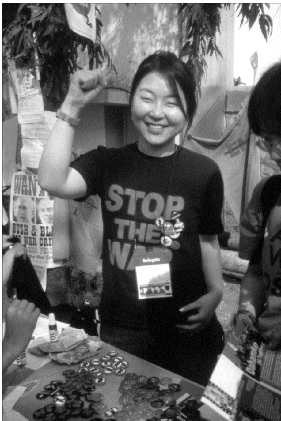
En koreansk delegat på konferensområdet.