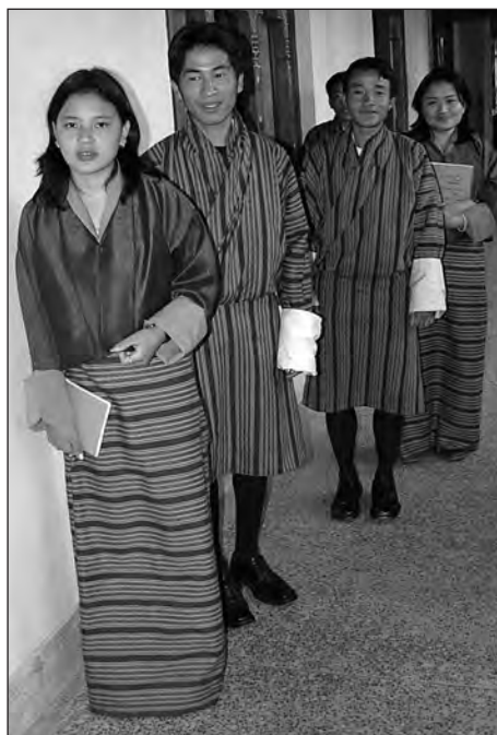
Studenter på Royal Institute of Management i Thimphu, Bhutan.