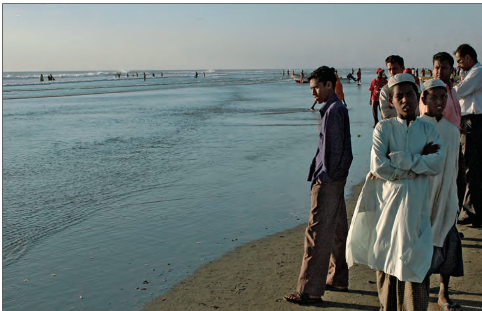
Strandliv på beachen i Cox's Bazar, Bangladeshs semesterparadis nära gränsen till Burma.