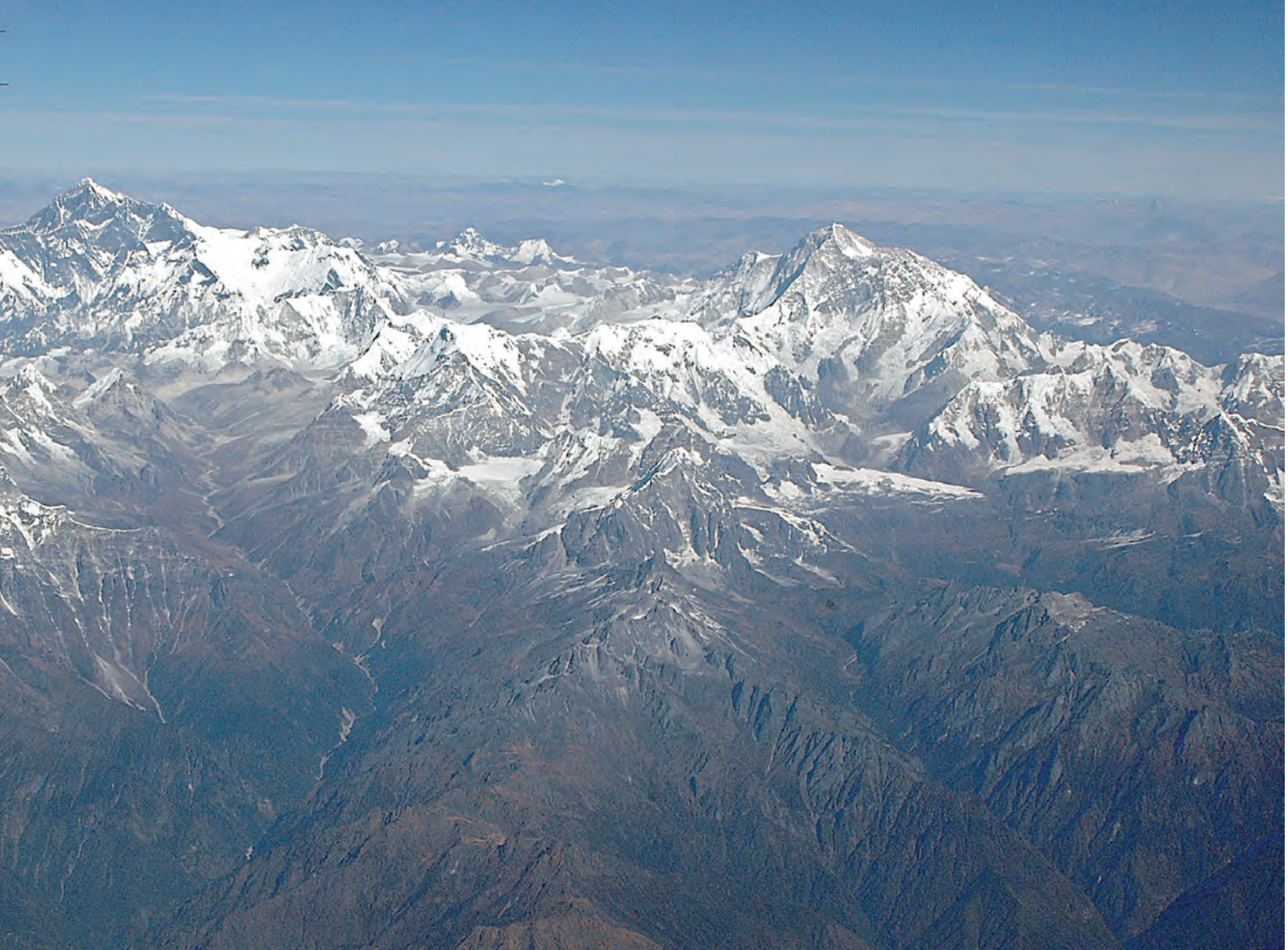
...k Airs flygning från Paro till Kathmandu.