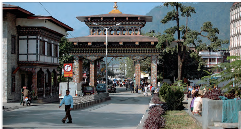
Porten till Bhutan. Gränsstaden Phuentsholing, systerstad med indiska Jaygaon.

För att vara ett land i Sydasiens är Bhutan verkligen landet annorlunda. Kvinnorna äger