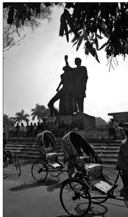
Bangladeshiskt frihetsmonument i Savar, norr om Dhaka.

Med det spända läget var det förstås färre turister än vanligt, och på Kathmandu Guest House i Thamel rådde det en viss stilltje när strömmen av ryggsäcksresenärer sinat betydligt. Ändå såg det mesta ut som vanligt och vi besökte och blev förevisade de välbevarade palatsen och tempen i