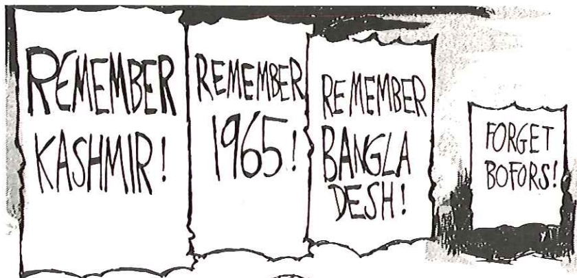
Teckning: Ravishankar (Indian Express)

De som redan inlett sina adoptioner, dvs fått sina ansökningshandlingar inlämnade på den lankesiska ambassaden, får dock fullfölja dessa.