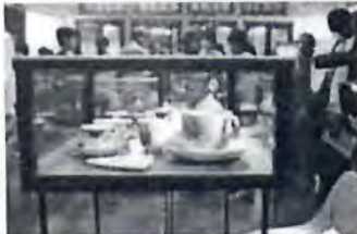
CUPPA CHEER: Teaware on display at the exhibition.

Be it hurried gulps from steaming kulhars or leisurely sips from Cha Bar crystals, tea is an anytime, anywhere drink. Yet, there was a time when tea producers had to plead with people to give it a try.