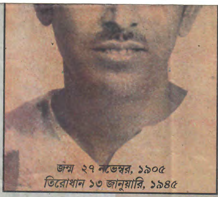
জন্ম ২৭ নভেম্বর, ১৯০৫ তিরোধান ১৩ জানুয়ারি, ১৯৪৫

আনন্দ, কপালে জ্ঞানের ভাঁজ, বচনে মিসটিসিজম, সময় সময় ঠোটে দুই-এক কলি 'আইনে ক্লাইনে নাখট মুজিক' কি কাফি-কানাড়া, আঙুলে লে-আউটের বিস্ময়-টান