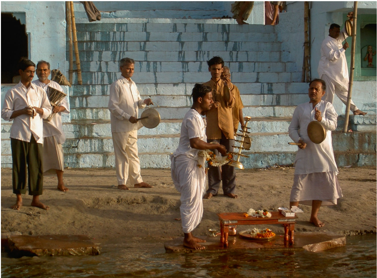
Hinduisk morgonritual vid floden Ganges i Varanasi