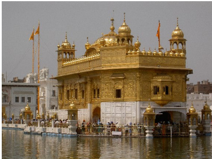
Harimandir Sahib (det Gyllene templet) i Amritsar

Resan är preliminärt beräknad att kosta ca 15000 SEK per deltagare, vilket inkluderar internationell flygresor, inrikesresor och logi i Indien, samt kostnader för vissa gemensamma programpunkter.