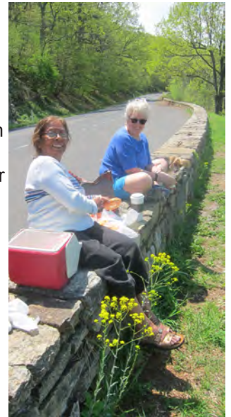
Picnic lunch in Shenandoah National Park