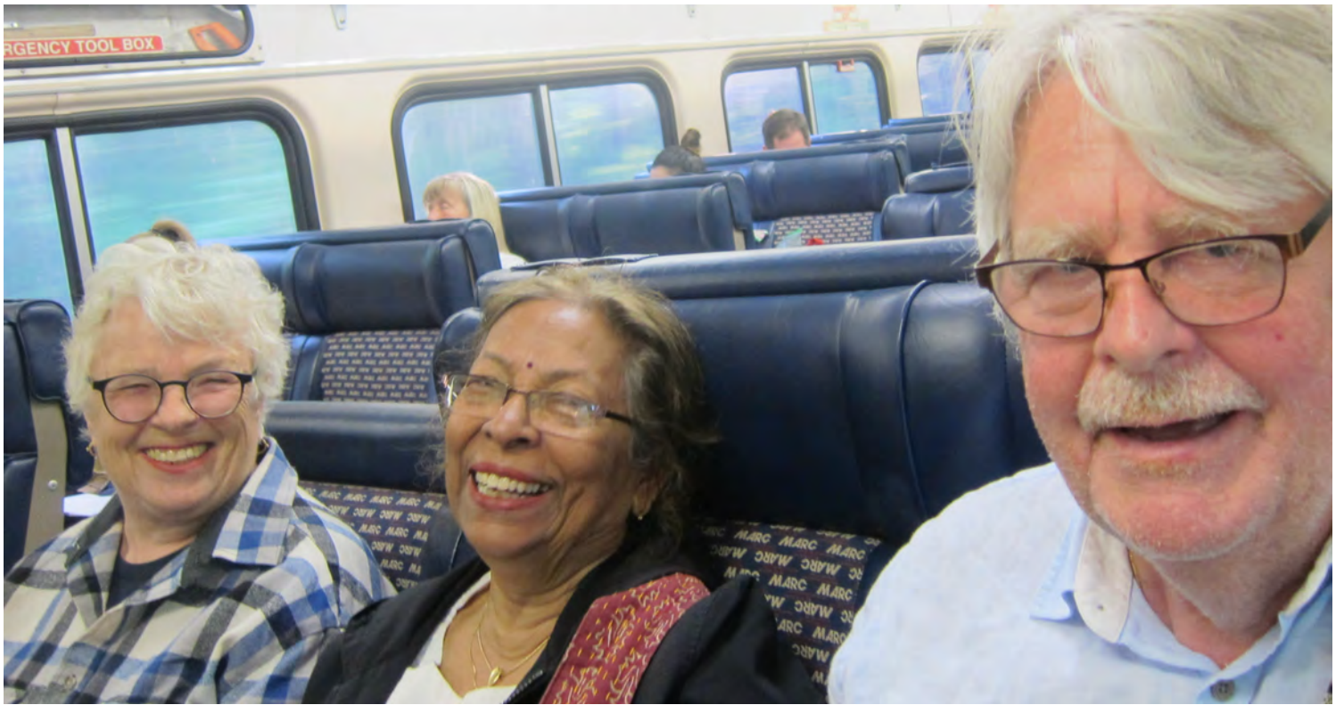
Tåg från Frederick till Washington D.C.