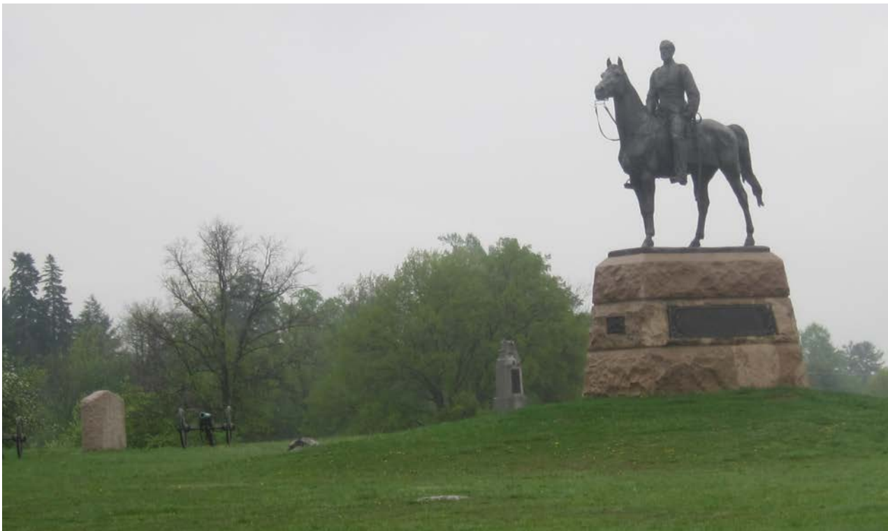
Slagfältet i Gettysburg från då fyllt av minnesmärken.