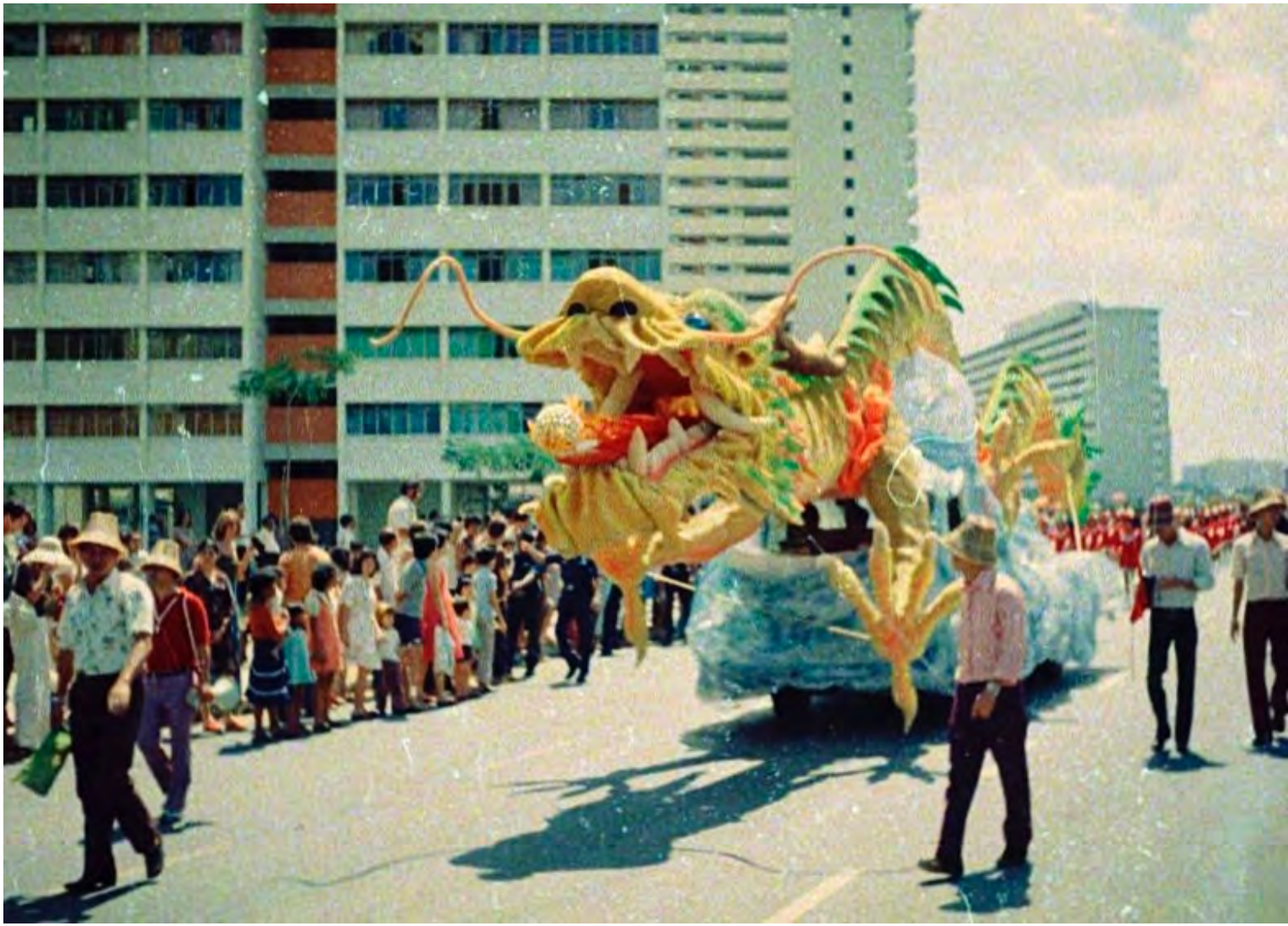
Nyår i Singapore